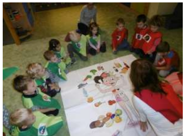
Program Hrátky zdravé pětky