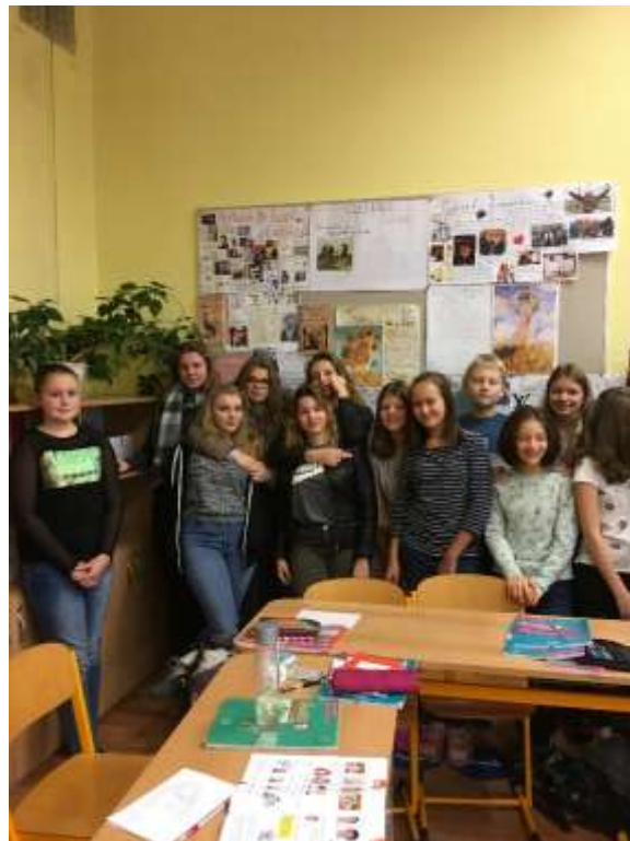
Studentky při návštěvě ZŠ Drtinova