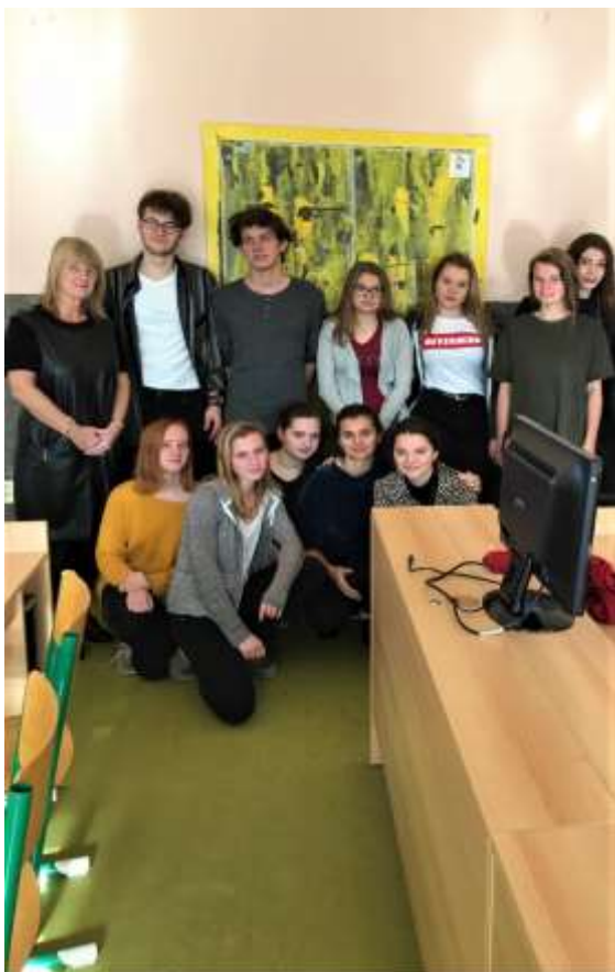
Návštěva gymnázia Na Pražačce