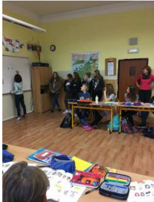
Vyučovací hodina na ZŠ Drtinova