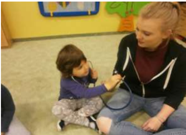
Program Rodiče představují svá povolání