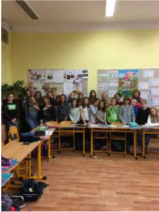
Vyučovací hodina na ZŠ Drtinova