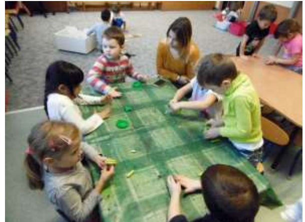
Projekt řemesla na hradě