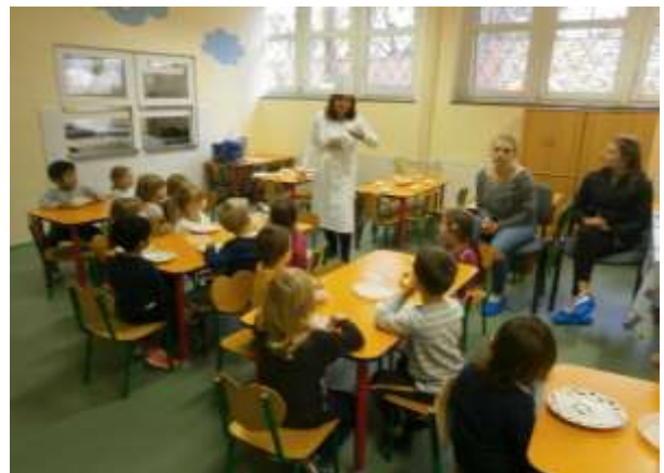
Projekt Zdravá výživa